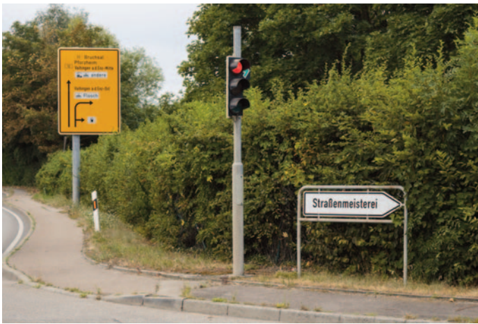
Die Verwahrstelle befindet sich direkt an der B10 vor der Straßenmeisterei.