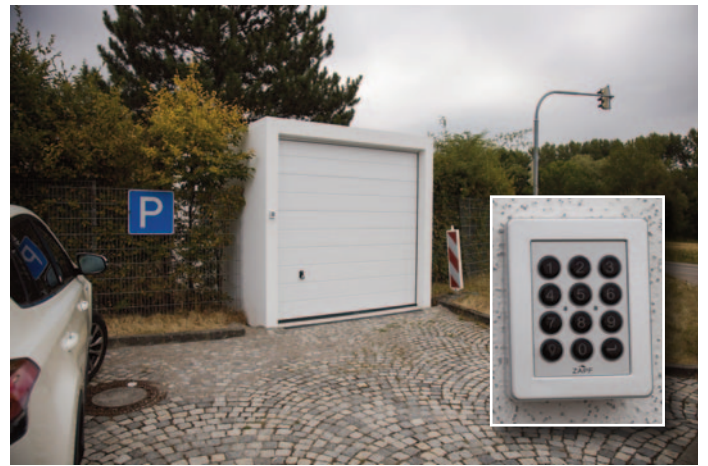
Die Verwahrstelle ist rund um die Uhr zugänglich. Zugang mittels Zahlencode.