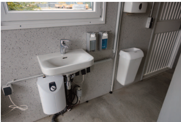
Warm/Kaltwasser, Seife, Desinfektionsmittel und Papierhandtücher. Keine Verpackungen in den Mülleimer werfen!