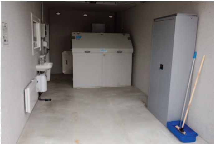
Der Container befindet sich in der Kühlbox. Hinweis: Zum Öffnen und Schließen ist etwas Kraftaufwand nötig.