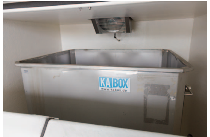
Den Container in der Box nur bis 10 cm unter den Rand füllen. Bitte auch Temperatur kontrollieren (+5 Grad).